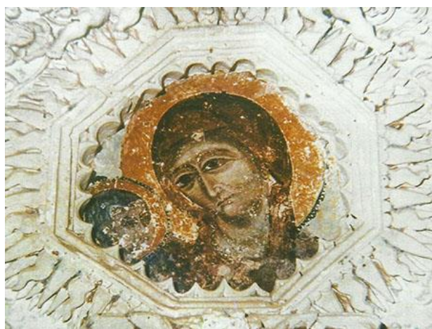
Santa Maria di Veglie

Anticamente a nord di Veglie all'interno di quella vasta area che attualmente comprende il convento, la cripta, la chiesa e l'antico cimitero, c'era una piccola chiesa dedicata a Santa Maria di Veglie; nel suo interno c'era un solo altare con l'affresco di una Madonna con Bambino, rinvenuto ed estratto da dentro una grotta che si trovava nelle vicinanze e che il popolo ed il clero di Veglie avevano assunto a protettrice del paese attribuendole il nome di Sanctae Mariae de Vigiliis .